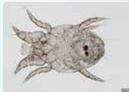
WAO Journal 2009; 2:91-96a

即時型アレルギーを引き起こす 原因：コナヒョウヒダニ 検査：水をつけて顕微鏡で確認 主にパンケーキ粉、日本ではお好み焼き粉も開封後は密閉できる容器に入れ、冷蔵庫で保存1ヶ月以内に使用すること